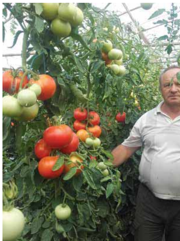
Berno F1 - Odlično zamatanje plodova tokom cijele vegetacije