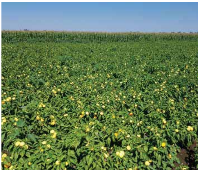
Békés F1 - Obilan i i znadprosječni urod vidljiv na prvi pogled

Za sigurnu i uspješnu proizvodnju koristite naše hibride BÉKÉS F1 i ISPÁN F1.