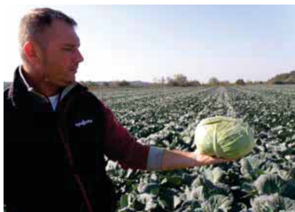
DISCOS F1, OPG Stambolija, Donji Miholjac