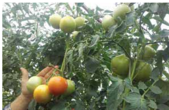
Berno F1 - OPG Divljaković, Breznica Našička