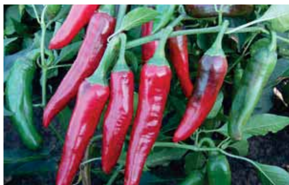
Jubileum F1 - odlično zametanje, koncentrirano dozrijevanje, rani prinos