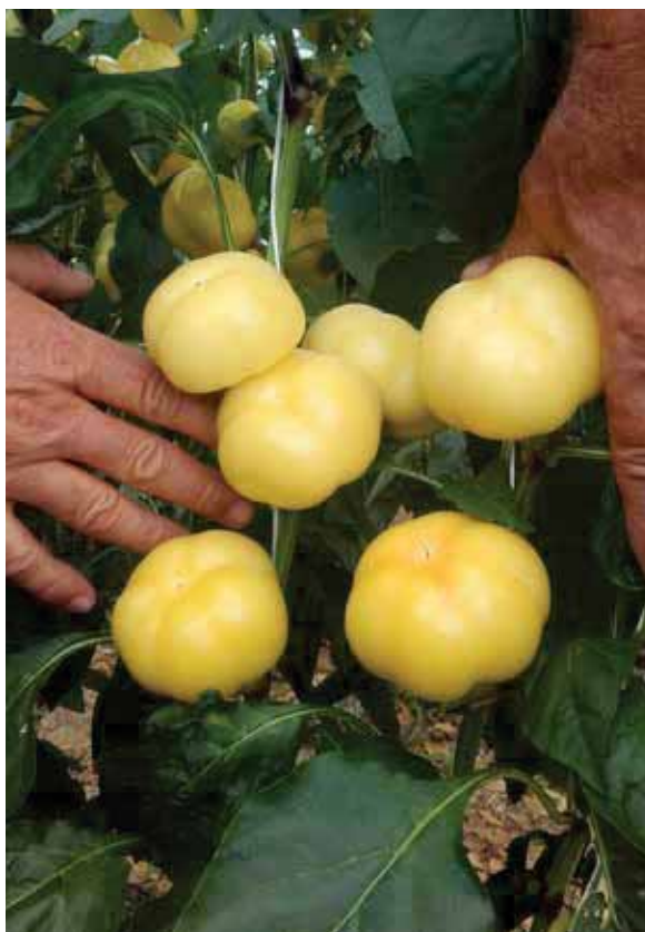
Békés F1 - OPG Divljaković, Breznica Našička