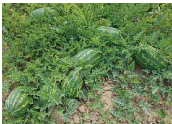
Dobro i stabilno zametanje plodova