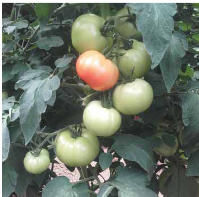
Berno F1 - OPG Divljaković, Breznica Našička