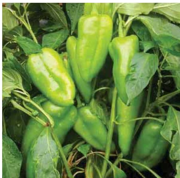
Mitoz F1 – obećavajući visoki prinos