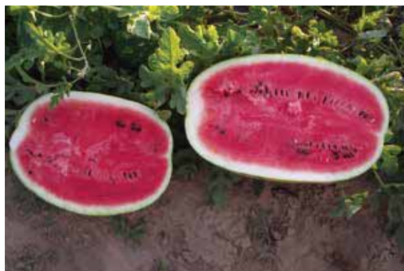
NAUTILUS F1 - kompaktno tamno-crveno meso

Priložene fotografije su iz doline Neretve (proizvođač Kapović Jure) i iz Županje (proizvođač Džinić Antun).