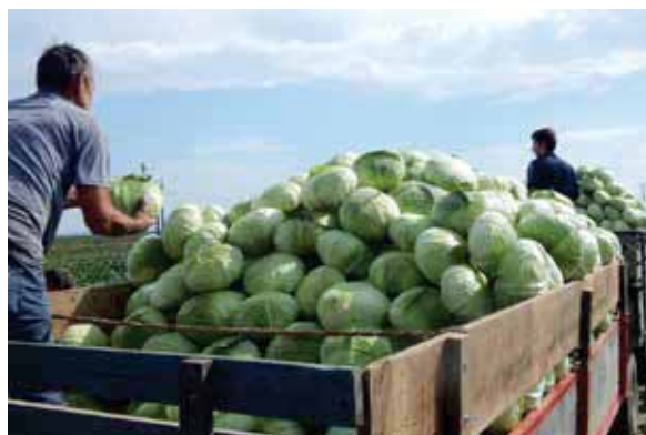
DISCOS F1, proizvođač iz Nedeljanca