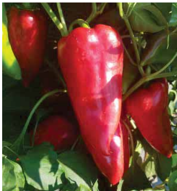
Mitoz F1 – Ujednačen oblik tokom cijele vegetacije

Iznadprosječna tolerancija na stres nije slučajna kod ovog hibrida jer je oplemenjivanje i genetska osnova potječu sa ovog klimatskog podneblja. Krošnja i lisna masa je bujna tokom cijele vegetacije i odlično pokriva plodove.