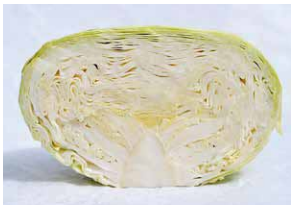
DISCOS F1 - Pravilna unutrašnja struktura, mali kocen i tanke lisne žile