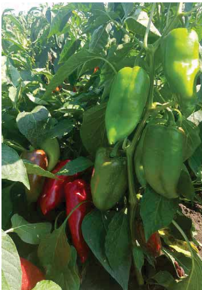
Mitoz F1 - početak ranog dozrijevanja