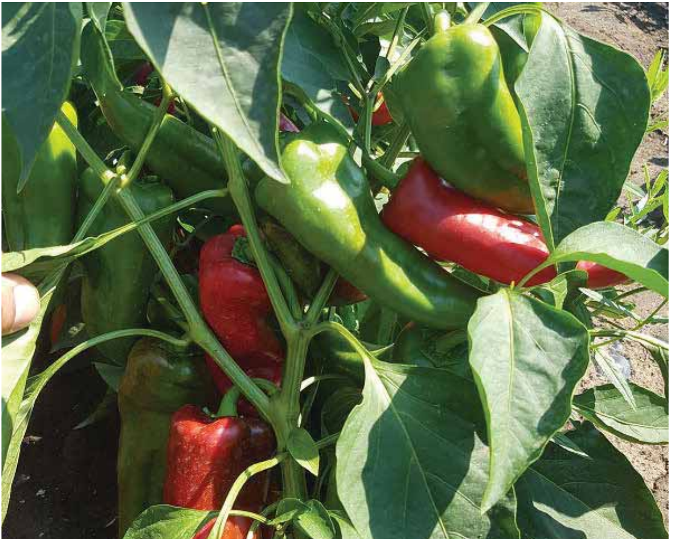
ZKI 09721 F1 - Kvalitetni i ujednačeni plodovi