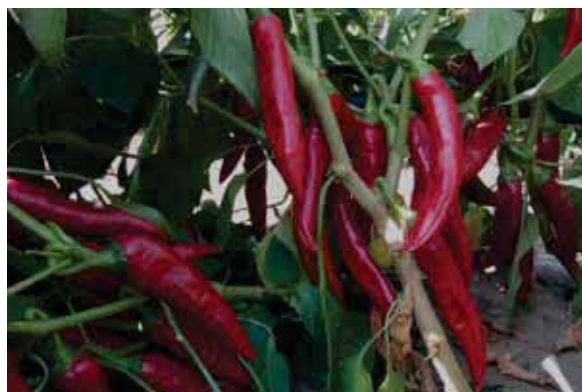
Bolero F1 - hibrid sa najvišim udjelom boje

Po pitanju savjeta i odabira slobodno nam se možete obratiti te za vlastitu sigurnost koristite originalno zapakrana ZKI sjemena koja su tretirana i zelene boje.