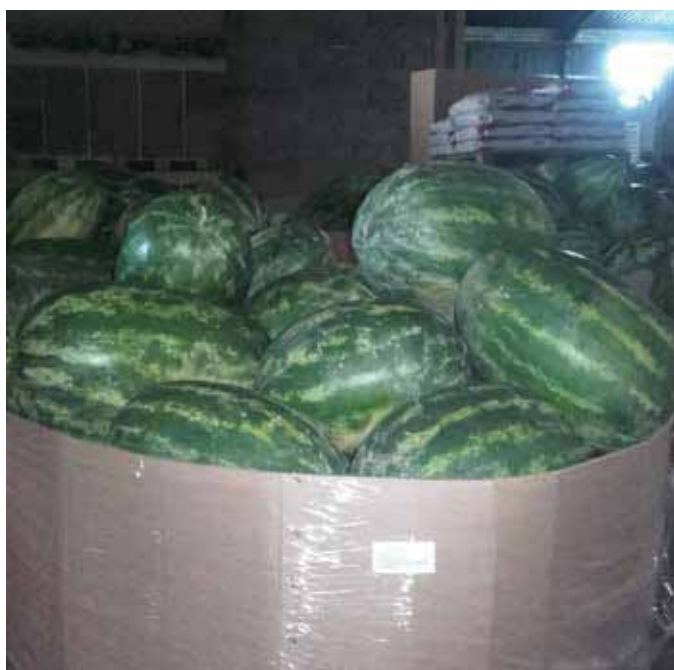
Pripremljena roba za transport u trgovance