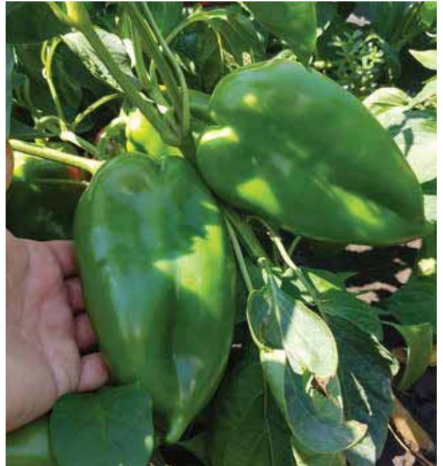
ZKI 09721 F1 - Veličina i oblik kakvog zahtijeva domaće tržište

Nadalje vjerujemo da će u bližoj budućnosti primjena hibrida u tipu kapije također prevladati kao što se desilo i sa paprikama u tipu babure, jer svi pokazatelji upućuju na taj smjer.