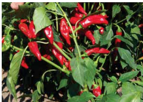
Szikra F1 - izvanredno koncentrirano dozrijevanje i visok udio kapsaicina