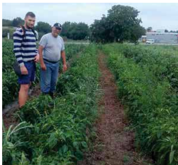
Mitoz F1 – OPG Rupčić iz Nuštra