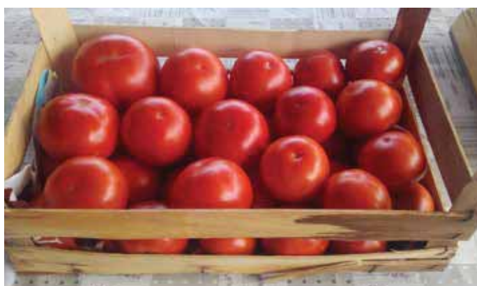
Berno F1 - OPG Fabian, Černa