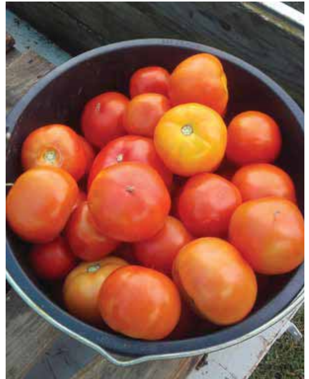
Berno F1 - OPG Divljaković, Breznica Našička

Za razliku od nekih hibrida koji imaju dobar rani prinos, ali kasnije imaju slabo zamentanje i limitiran ukupan prinos, Berno F1 ima odlično zamentanje tijekom čitave vegetacije. Plodovi ostaju krupni i na vršnim cvjetnim granama, pa uz dobro zamentanje, prinosi su vrlo često rekordni. Prosječna težina plodova je preko 300g. Berno F1 je hibrid namenjen proizvođačima koji svoju robu većinom prodaju na domaćem tržištu.