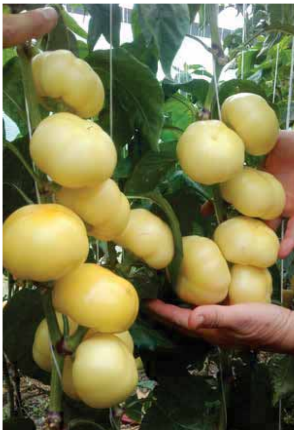
Békés F1 - Sigurno zemetanje tokom ljeta - pouzdan i visoki prinos