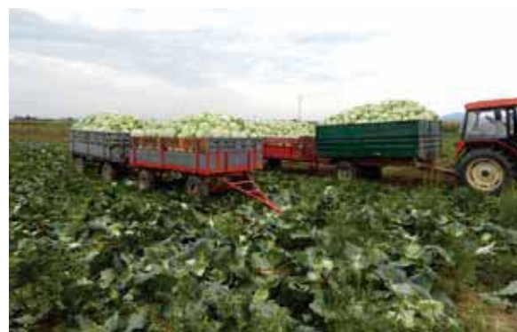
DISCOS F1, proizvođač iz Nedeljanca