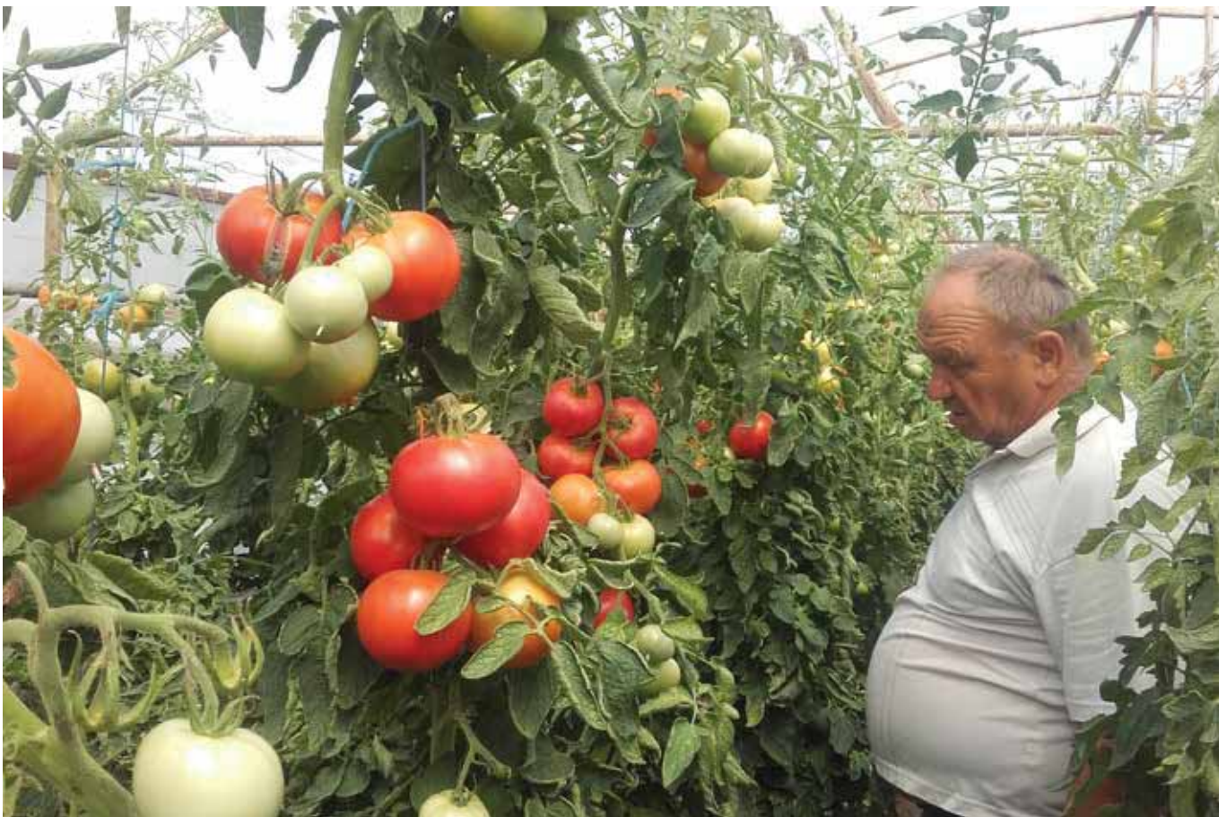
Berno F1 - OPG Fabian, Cerna. Jednolično i kvalitetno zamentanje cvijetova tokom cijelog ljeta, svaka cvjetna grana ima 5-7 velikih plodova i na visini 2 metra