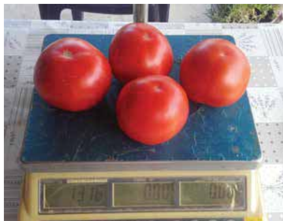
Berno F1 - OPG Fabian, Černa