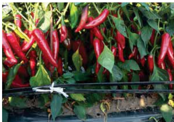
Palotás F1 - iznadprosječan broj plodova, rekordan urod